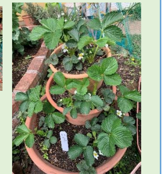
イチゴも白い花を、いっぱい咲かせています。食べるのが楽しみです。