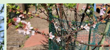
築山の上のゆすらうめ。さくらんぼのような、果実をつけます。