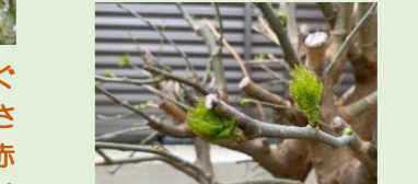
夏に飼育する、蚕のえさの桑の葉も、新芽が出ています。