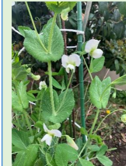
スナップエンドウは、白いきれいな花が咲きます。

<園庭だより> 園庭は、花盛り。春の訪れが早く、草花の芽吹き勢を感じます。これからも保育理念に基づき、“身近な自然とのふれあいの中で五感(感性)をはぐくむ環境づくり”を目指してまいります。