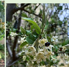
階段下の“びっくりぐみ”。黄色い花が、たくさん咲いています。夏に赤い果実をつけます。いくつできるか、楽しみです。